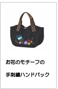
お花のモチーフの 手刺繍ハンドバック

★オンラインストア★ www.craftaid.jp 公益社団法人シャンティ国際ボランティア会