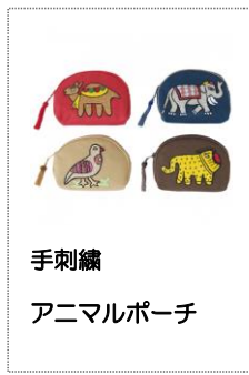
手刺繍 アニマルポーチ