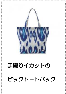
手織りイカットのピクトートバック