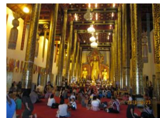
Wat Chedi Luang

タイもコンビニが溢れている社会驚きはセブンイレブンがほとんどというか、オンリーワンです。