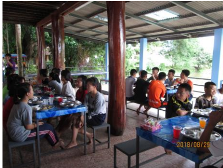
歓迎の昼食会風景