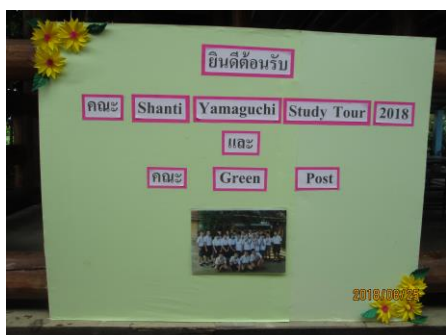
シャンティ学生寮 ウェルカムボード