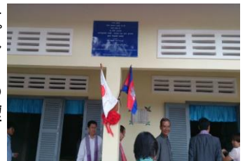
右プレートの場所