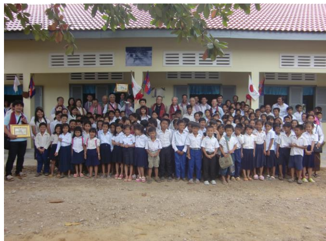
ノーリア小学校の皆さんと記念撮影

子供たちの目は輝き、口は大きく開かれ、白い歯が元気であることを表しているように、その笑顔は生き生きとしていました。昔懐かしい映画やドラマで見たような光景で、今の日本にはないエネルギーを感じました。