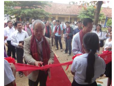
テープカットする理事長