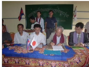
ノーリア小学校校長への引渡し署名