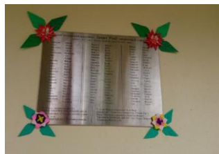
左プレート（会員名簿）