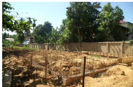
校舎の基礎づくり

写真（左）にありますように、学校の基礎工事が始まりました。コンクリートの基礎梁の準備をしています。