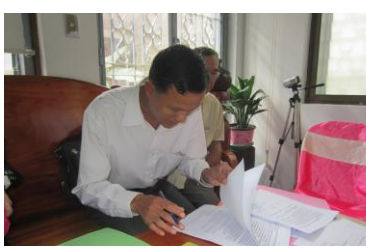
ノーリア小学校の校長先生との引き渡し契約